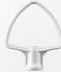
مضرب مسطح Flat Beater