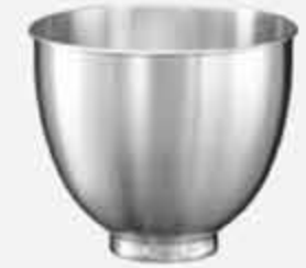
وعاء سعة ( 3.3 ) لتر (3,3) L work bowls