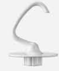
مضرب العجين Dough Hook

أبعاد التغليف (سم) Packing Dimensions (cm)