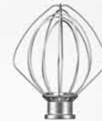
خفاقة من 6 أسلاك 6-Wire Whip