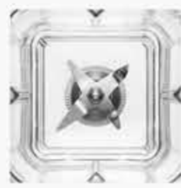
شفرة من الاستانلس ستيل stainless steel blade