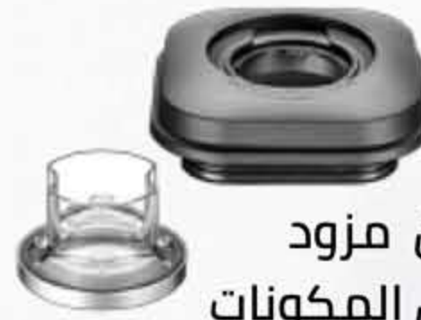
غطاء آمن مزود بكوب لقياس المكونات Secure, vented lid with ingredient measuring cap