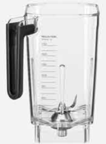
إناء سعة 2.6 لتر 2.6 L BPA-free graded

أبعاد التغليف (سم) Packing Dimensions (cm)