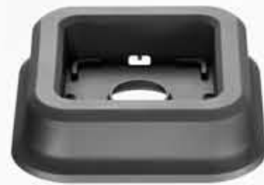
حامل لإناء stabilizer jar pad