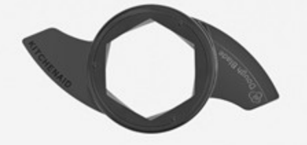
شفرة العجن Dough blade

أبعاد التغليف (سم) Packing Dimensions (cm)