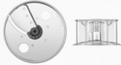
مقبض تقطيع قابل للضبط من الخارج وقرص تقطيع Dicing kit and dicing kit clean out tool