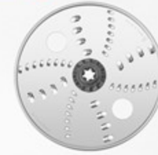
قرص البشر الناعم والمتوسط القابل للعكس Reversible fine and medium shredding disc