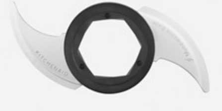
شفرة متعددة الاستعمالات Multi-purpose blade