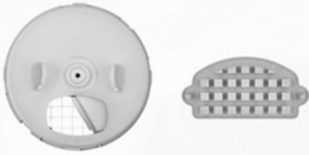
مجموعة التقطيع وأداة تنظيف مجموعة التقطيع Dicing kit and dicing kit clean out tool