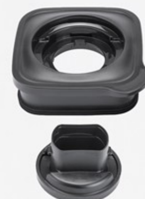
غطاء محكم الإغلاق Tight lid