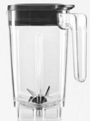
وعاء (دورق) Pitcher